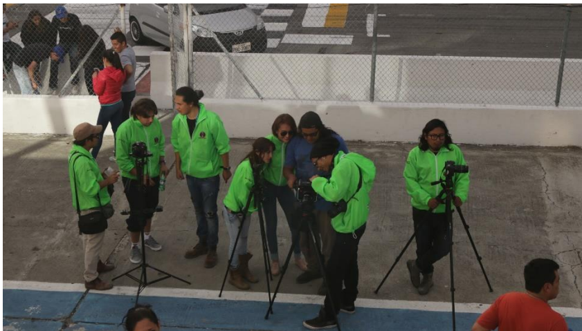
Imagen # 21: (Race Yahuarcocha – Ibarra)