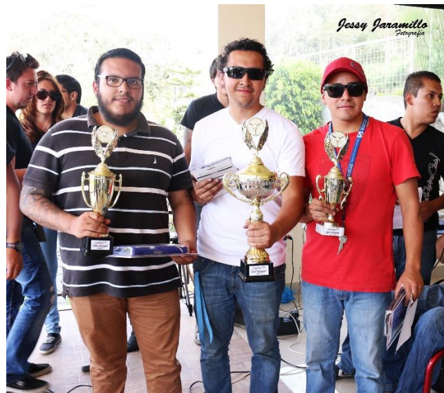
Imagen # 3:

Se puede observar a la persona desde la cabeza hasta la rodilla, este plano era muy utilizado en las películas de vaqueros, ya que permitía ver las cartucheras de las pistolas dando así un mayor realce a la escena y al actor.