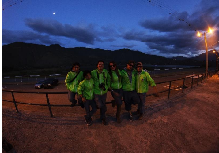
Imagen # 20: (Race Yahuarcocha – Ibarra)