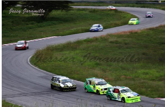
Imagen # 2: