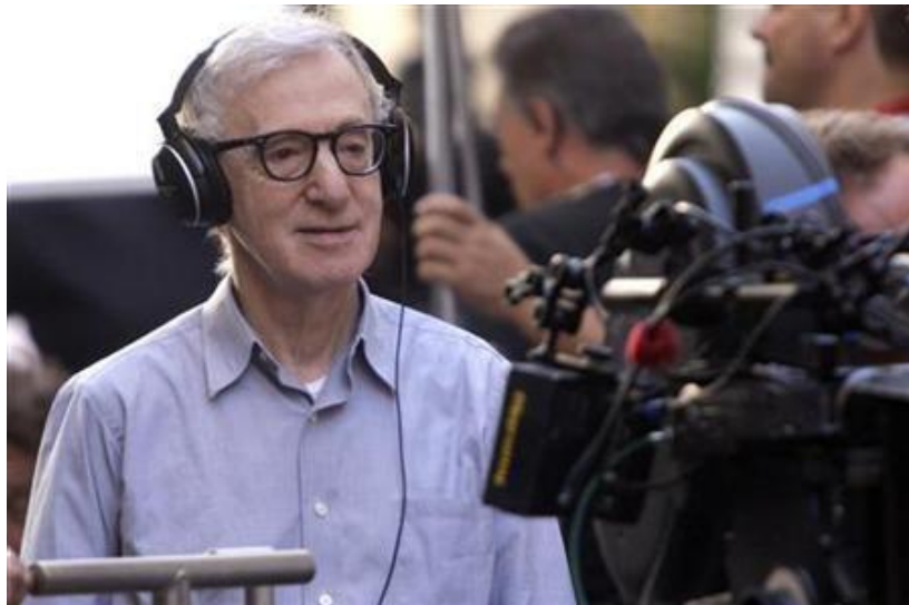
Imagen # 9:

Es el líder de producto audiovisual, es la persona encargada de dirigir la filmación de una película, instruye a los actores, decide la puesta de cámara, supervisa el decorado y el vestuario, y todas las demás funciones necesarias para llevar a buen término el rodaje.