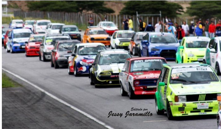
Imagen # 8: