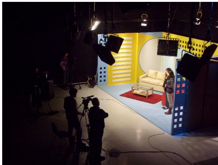
Imagen # 7:

La iluminación es una parte importante en la producción audiovisual, ya que no es lo mismo las luces que normalmente se tienen, que colocar en lugares determinados iluminancia. Con esto se consigue crear ambientes que visualmente no se ve bien, hacer esto es un arte que el director de fotografía lo realiza.