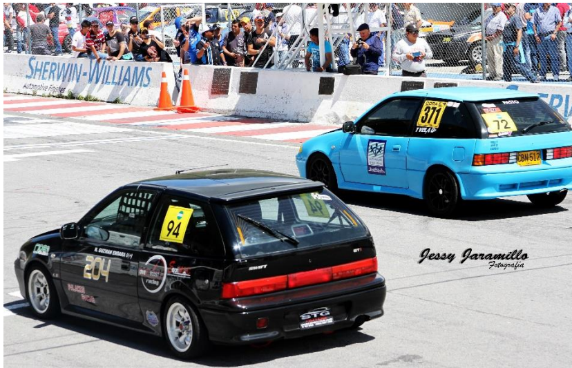
Imagen # 14: (Race Yahuarcocha - Ibarra)