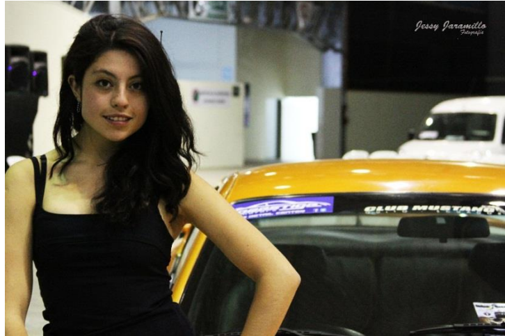
Imagen # 4: