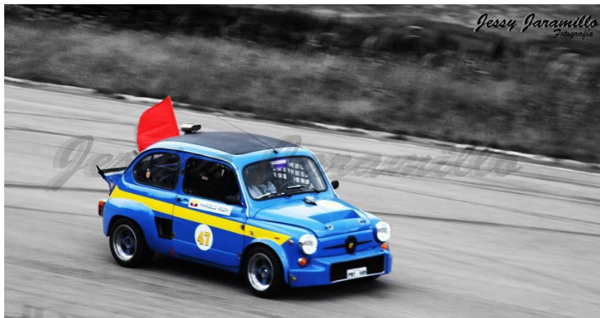
Imagen # 15: (Race Yahuarcocha – Ibarra)