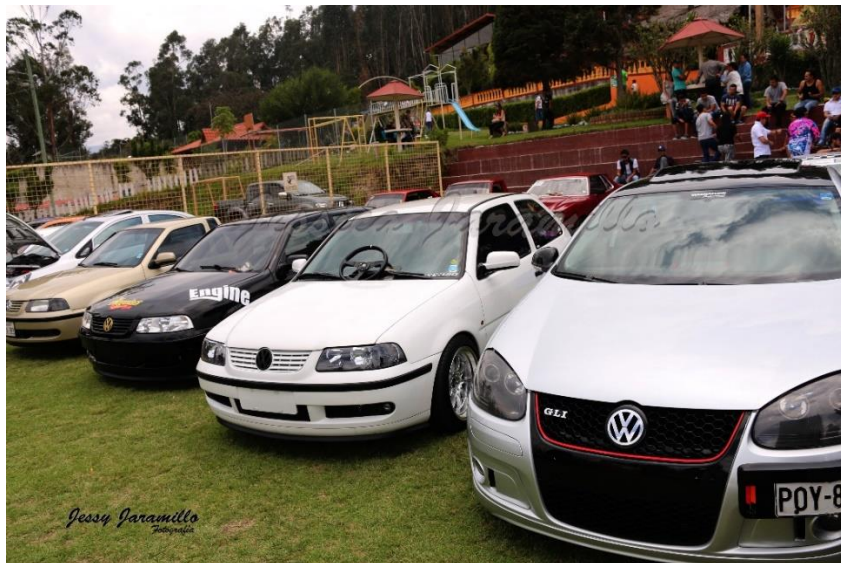
Imagen # 19: (Meet 2015; Fuente: La Autora)