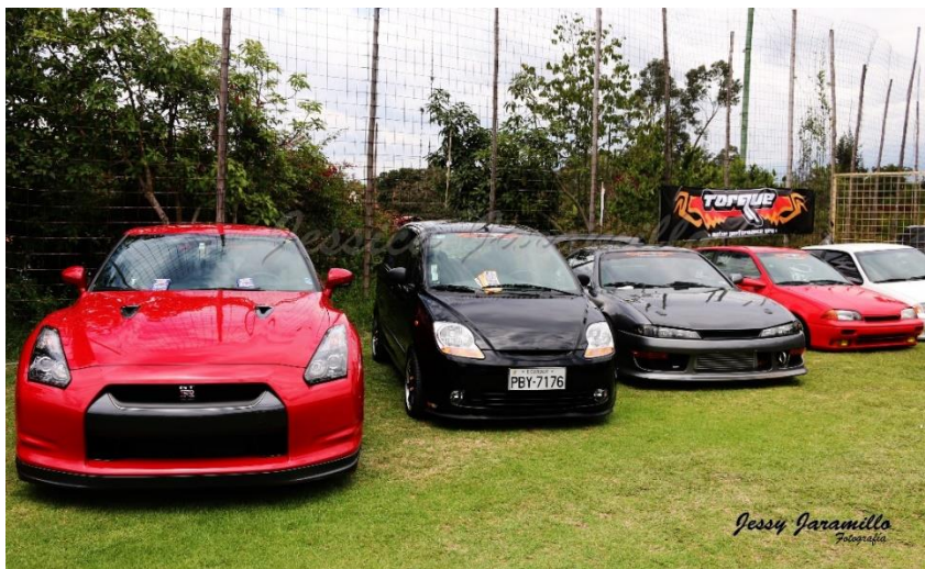
Imagen # 18: (Meet 2015)