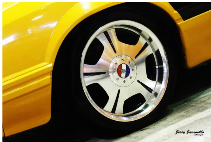
Imagen # 5:

Este se utiliza para dar fuerza a la imagen, se ve la expresividad del personaje, tener cerca de la cámara la imagen hace que el espectador sienta cierta intimidad, interactúa con el espectador. No importa el entorno en donde se encuentre sino saber cómo es la persona que habla.