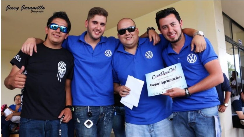
Imagen # 17: (Meet 2015)