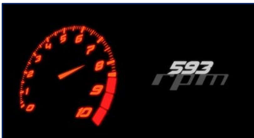
Imagen # 13: (Logotipo del Corto Documental)