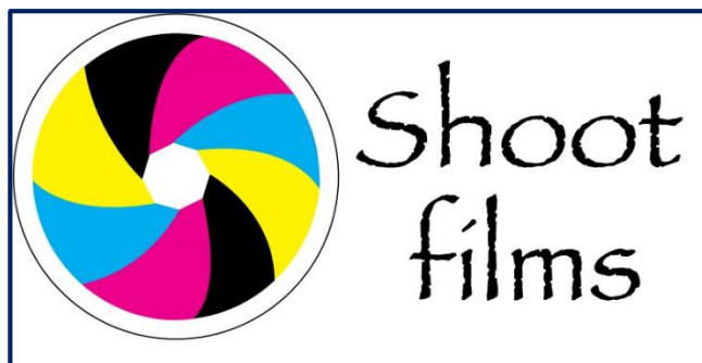
Imagen # 10: (Logotipo de Producción – Productora)