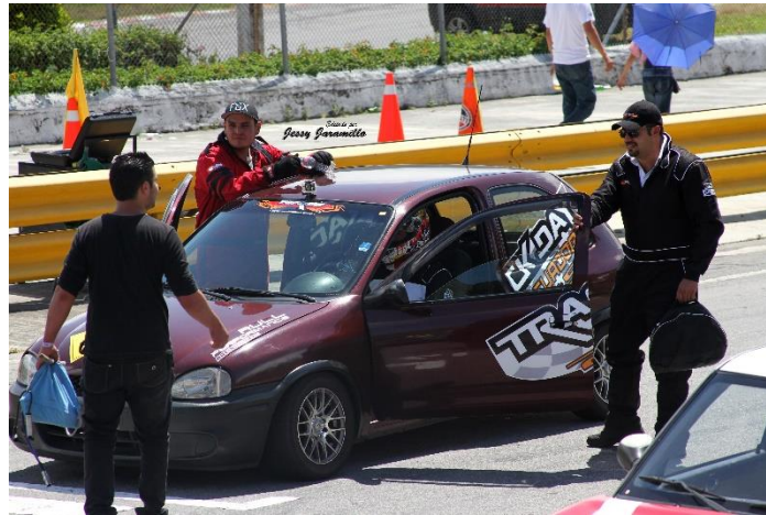
Imagen # 1:

Es la representación visual de un objeto o persona plasmado en un plano. Como lo vemos y como lo vamos a encuadrar.