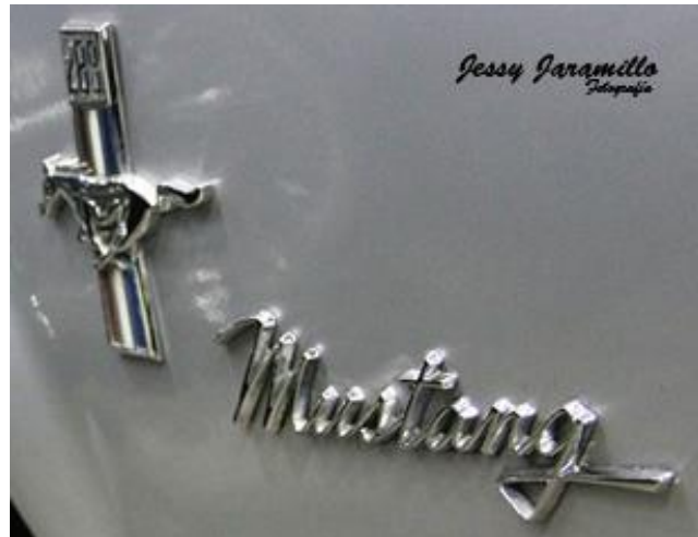
Imagen # 6: