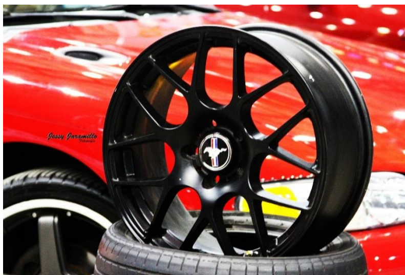
Imagen # 16: (EXPO 2015)