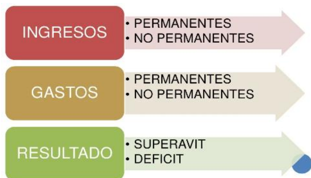
Figura 4. Componentes del Presupuesto General del Estado

Nota. El gráfico muestra los recursos financieros que tiene el Ecuador, Tomado de Encalada et al, 2020.