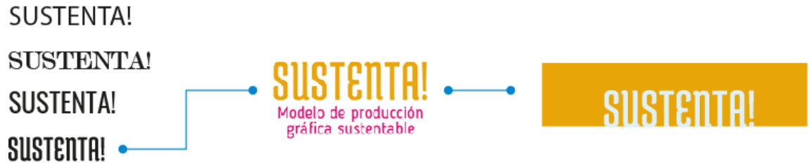
Figura 5: Identificador de la guía