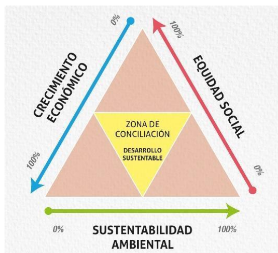
Figura 2: Triángulo de Nijkamp

Fuente: Elaboración propia basada en Zarta Ávila (2018) ; triángulo de Peter Nijkamp.