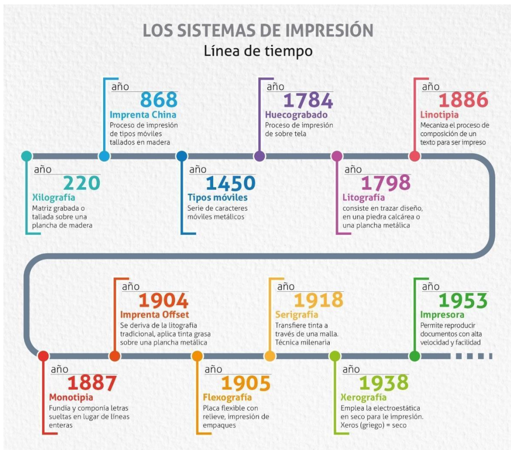
Figura 1: Línea de tiempo de los sistemas de impresión

Según Báez (2015) La creación de la imprenta generó un cambio histórico en el mundo y la sociedad, ya que permitió el acceso a información restringida por un selecto grupo de personas, en especial la iglesia católica. La mayor cantidad de copias en menor tiempo facilitó la rápida difusión de información a un mayor número de personas, aumentó el número de individuos interesados en la lectura y en adquirir nuevos conocimientos. (Eisenstein, 1994)