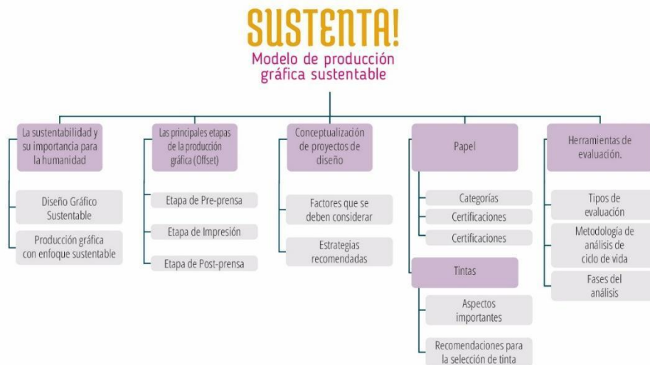
Figura 6: Estructura