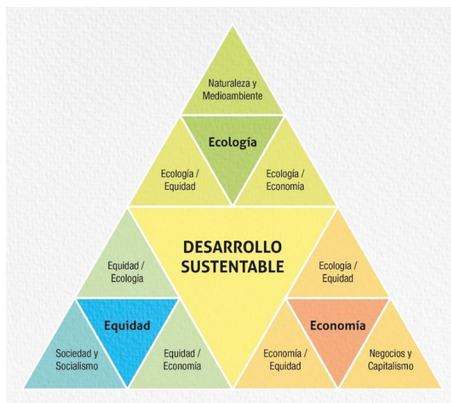
Figura 4: Triángulo fractal de la sustentabilidad

Fuente: Basado en la Pirámide de la sustentabilidad creado por William McDonough.